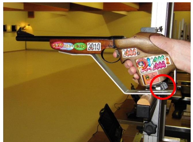
Anschlagart: „Freie Pistole Auflage“ (Ein Anschlagen des Ladehebels an der Waffenaufgabe darf nicht möglich sein)

Die Hand des Schützen umfasst den Pistolengriff. Der Handballen oder der Pistolengriff an seiner tiefsten Stelle, gelten als Auflagepunkt der Pistole auf der Auflage. Das Handgelenk muss im Anschlag völlig frei sein. Ein Arretieren oder Anschlagen seitlich und auf der Auflage ist nicht gestattet.